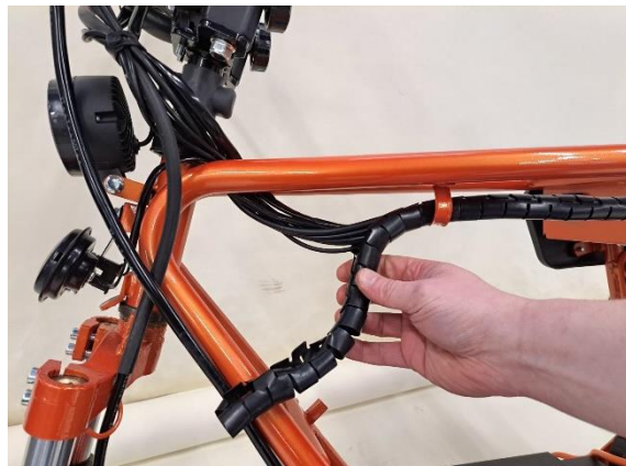
Irrota johtosarjan suoja.