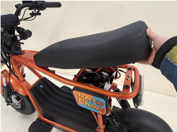
Ota istuin pois.