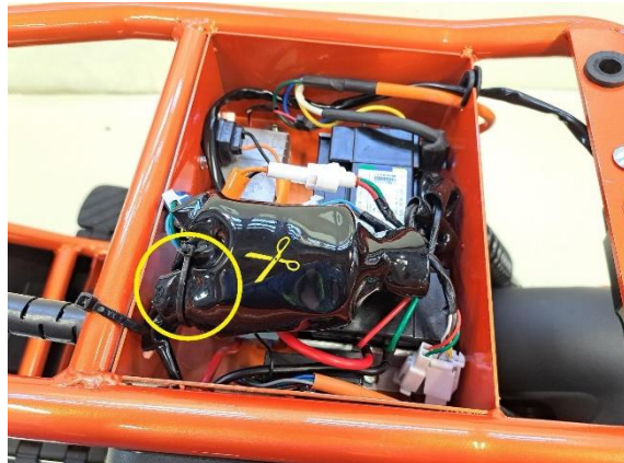
Katkaise johtojen suojaa kiinni pitävä nippuside (sivuleikkurit).