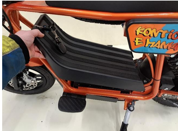
Ota akkukotelon kansi pois.