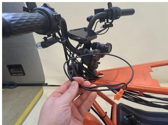
Ota vasemman etuvilkun johto irti johtosarjasta.